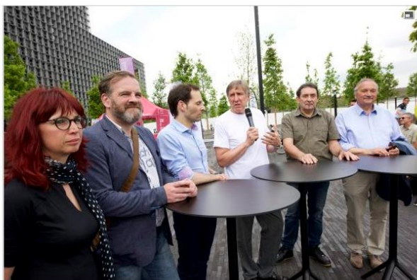
27.05 Le ministre du Développement durable, François Bausch, a rappelé l'importance de développer la mobilité douce au Luxembourg lors du Vélos-Tour Sud 2016.

BELVAL - À l'occasion du Vélos-Tour Sud 2016 , organisé par le syndicat Pro-Sud et l'Uni, le ministre du Développement durable a rappelé l'importance de la mobilité douce.