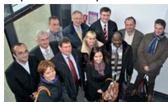
La délégation à Lille

bourgeoise car il existe de nombreux parallèles avec les projets de Belval. Les questions relatives aux transports et au logement revêtent une importance particulière,