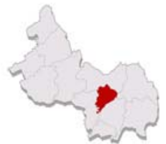
Schifflange au sein du syndicat PRO-SUD

villes et communes qui se défient dans le cadre d'une série de compétitions sportives et culturelles. En 2013, Schifflange sera pour la 2ème fois depuis 2003, l'organisatrice de ce festival.