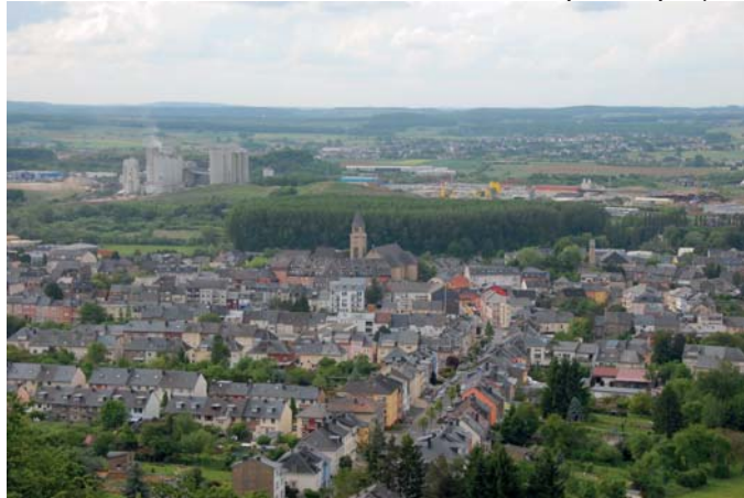
Schifflange, vue de la « Plakeger Kopp »

Schifflange compte à ce jour près de 9.000 habitants, la barrière des 10.000 habitants sera cependant vite franchie si le dynamisme qui se traduit par la construction de nouvelles zones d'habitation et industrielles persiste. Déjà maintenant, la densité de la population est surprenante. Près de 1.200 habitants par km 2 vivent sur un territoire relativement exigu de 771 ha. Au niveau de la densité, Schifflange occupe ainsi la troisième place parmi les communes du Sud, derrière Esch/Al et Pétange. La qualité de vie n'en souffre pas forcément, au contraire, elle est relativement élevée à