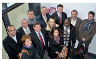
Die Delegation in Lille

nahmen die Luxemburger wichtige Erkenntnisse mit. Ein großes Augenmerk sei auf die Bereiche Transport und Wohnungsmarkt zu legen.