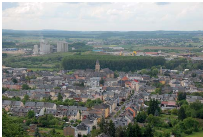
Schifflingen, von der „Plakeger Kopp“ aus

dass Schifflingen am europäischen Netzwerk „European Peoples Festival“ teilnimmt. Hier treffen sich jedes Jahr Städte und Gemeinden und messen sich im Rahmen von sportlichen und kulturellen Wettbewerben. 2013 wird Schifflingen sogar zum zweiten Mal nach 2003 Gastgeber des Festivals sein.