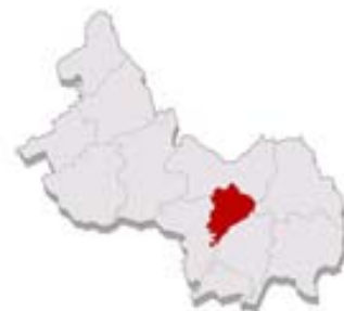
Schifflingen im Syndikat PRO-SUD

meindebad, ein Leichtathletikstadion, zwei Fußballstadien, zahlreiche Boule-Felder, ein Schießstand sowie Tennisplätze und eine Tennishalle unterstreichen den sportiven Anspruch in Schifflingen. Daneben bietet die Gemeinde auch jungen